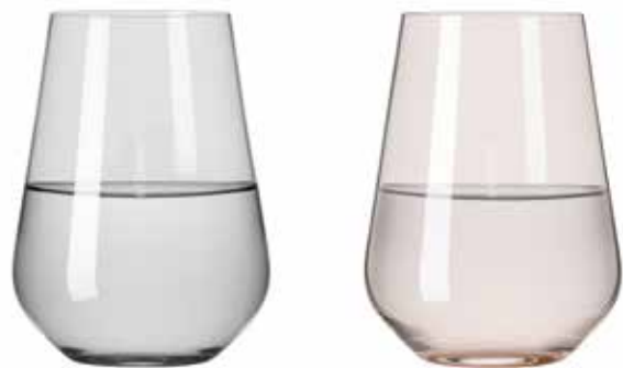
FJORDLICHT WASSER # 1, # 2, # 3, # 4

Die Natur als Vorbild: Das Wasserglas-Set inszeniert mit stark reduzierten Farben die ruhigsten Stunden des Tages – je nach Farbwahl lässt es die Sonne langsam auf- oder untergehen.